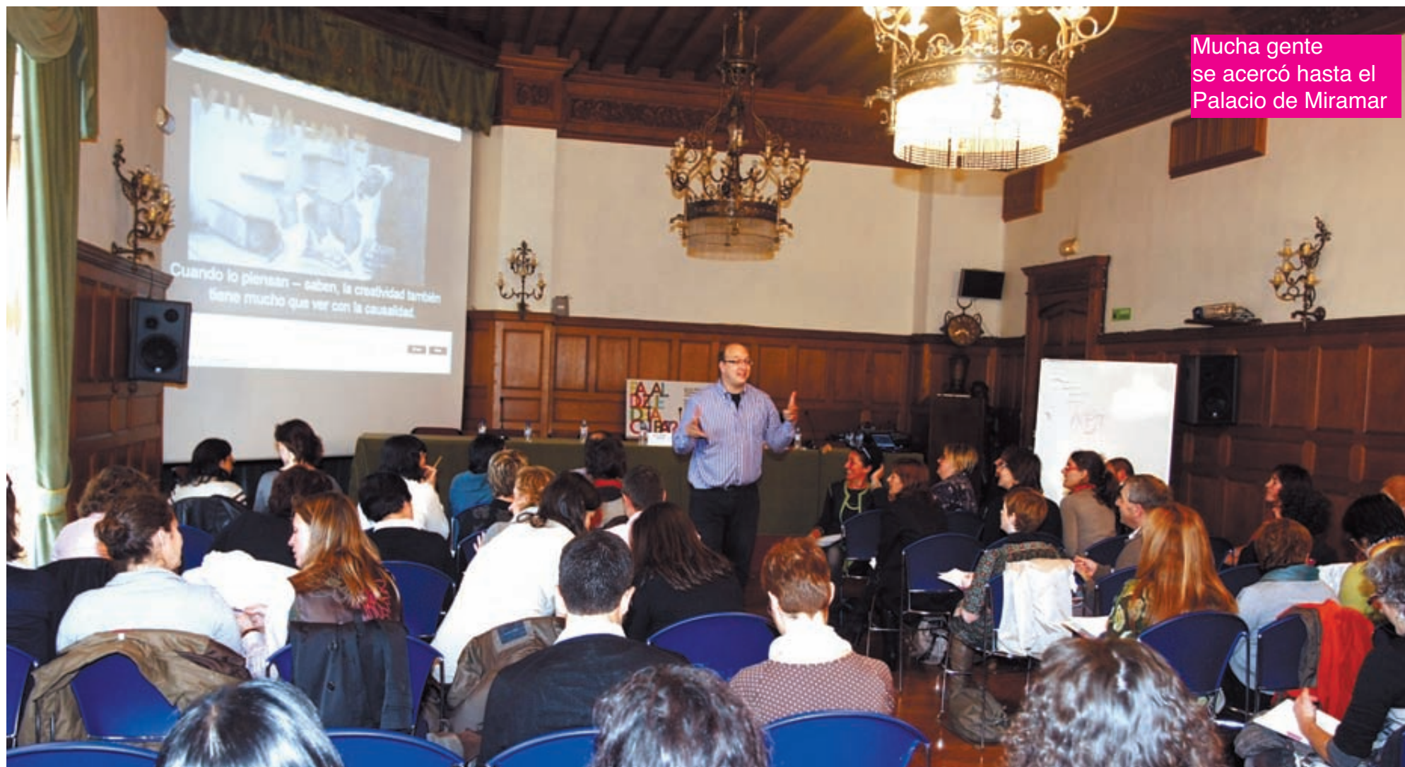
Mucha gente se acercó hasta el Palacio de Miramar

ta a la semana) y que lo vean tus hijos e hijas; escápate a Las Landas con la familia y practica el inglés de "quiero un pan" o "dónde está..." (incluso el francés); los dibujos que ven repetidos (no el primer capítulo, pues me odiarán vuestros hijos), ponedlos en inglés con la TDT... y mil más... ¡piensa tú...!