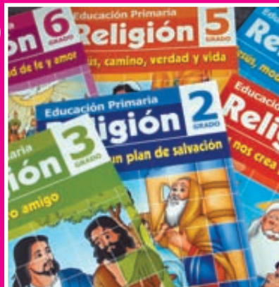
ERLIJIOA ESKOLA ORDUTEGITIK KANPO