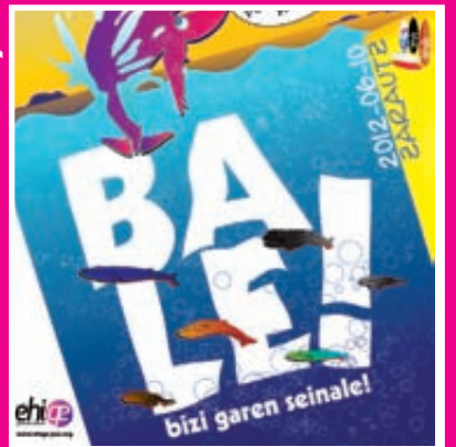
EUSKAL ESKOLA PUBLIKOAREN 21. JAIA